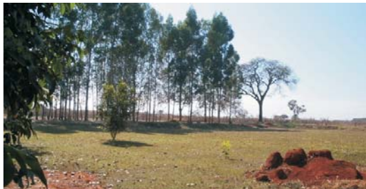
A área, além de ficar próxima a uma imensa reserva ambiental, conta com belas espécimes vegetais