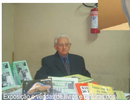
Exposição e vendas de livros e pinturas dos servidores também fizeram parte das comemorações do aniversário do TCE