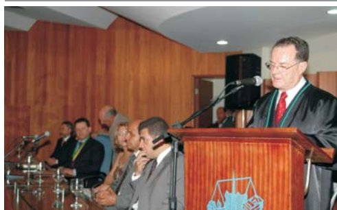
O discurso do presidente está transcrito na página 6