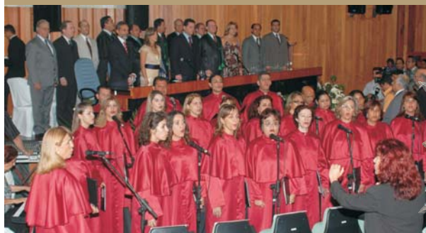
O Coral Vozes do TCE fez a abertura do evento entoando o Hino Nacional Brasileiro e canções populares