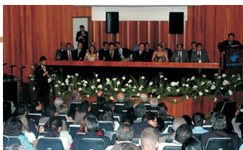
O auditório da Asmeço recebeu autoridades e servidores do TCE