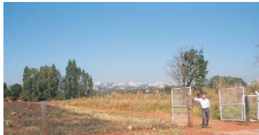
Ao fundo, tem-se uma bela visão do centro da capital goiana