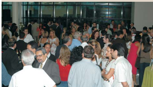
Após a solenidade, foi oferecido um coquetel aos presentes, juntamente com o lançamento do livro O Portal do Paraíso

O ponto alto das comemorações do 53º aniversário do TCE-GO foi a outorga das medalhas de mérito Rui Barbosa e Henrique Santillo a personalidades locais e nacionais.