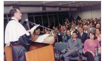
O auditório estava lotado de familiares e convidados dos homenageados